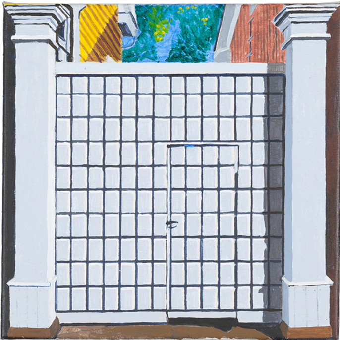
Marja Nurminen: Umpikuja, 2018, akryyli kankaalle, 33 x 33

ovat läsnä. Suru työn kuormittavuudesta sekä ilo saada opettaa itselleni tärkeää asiaa eli taidetta. Iloa myös siitä, että saan kohdata lahjakkaita opiskelijoita ja yhdessä heidän kanssaan saan olla taiteen äärellä.