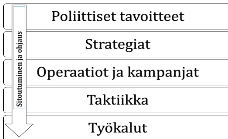
Taulukko 1. Kyberturvallisuuden poliittinen ja strateginen kehittäminen.

Kyberturvallisuudella voi arvioida olevan kaksi lähtökohtaista haastetta. Ensinnäkin kyberturvallisuudesta, digitaalisen toimintaympäristön turvallisuutena, keskustellaan edelleen varsin teknologiapainotteisesti. Teknologiaa ja teknisiä ratkaisuja luonnollisesti kyberturvallisuuden parantamiseksi tarvitaan, mutta tämän päivän Suomessa kyberturvallisuus tulee ymmärtää ensisijaisesti strategisena ja vahvaa poliittista ohjausta vaativana asiana. Kyberturvallisuuden asiat ovat esimerkiksi yksi erottamaton osa Suomen ulko-, puolustus- ja turvallisuuspolitiikkaa. Poliittisten linjausten ja strategioiden tulee määrittää kyberturvallisuuden kokonaisuuden kehittämistä. Tämän takia voi pitää myönteisenä, että Suomessa julkaistiin vuonna 2013 kansallinen Kyberturvallisuusstrategia, jolla pyritään kokonaisvaltaisesti kehittämään suomalaisen yhteiskunnan kyberturvallisuutta. Hieman yksinkertaisten kyberturvallisuuden kehittämistä voi kuvata taulukon 1 mukaisesti, jossa korostuu ”ylhäältä-alas” ohjaavuuden ja sitoutuneisuuden merkitys.