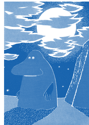
Mörkö Tove Janssonin teoksessa Kuka lohduttaisi Nytyitä? (1960)