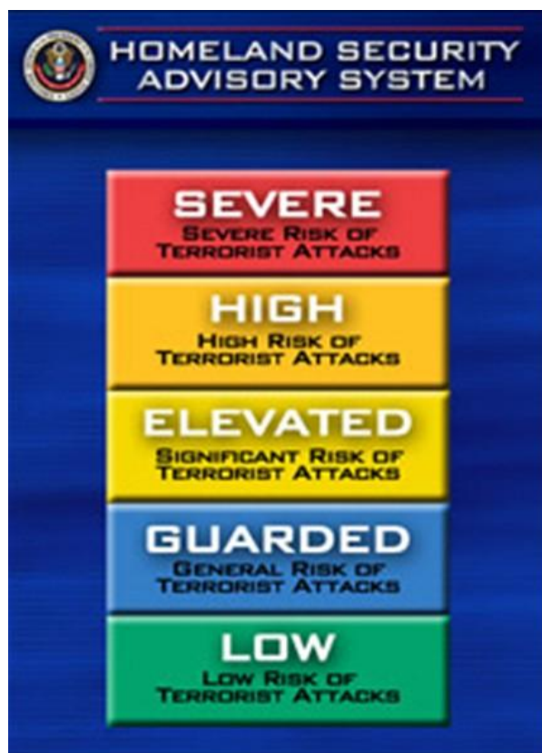
Kuva 1. Valtakunnallinen värikoodijärjestelmä kuvaamaan terrorismin uhkaa ( Homeland Security Advisory System ). 18

Yhdysvallat on historiallisesti luottanut rajaturvallisudessa maantieteelliseen sijaintiinsa kahden ystävällisen naapurin välissä ja valtamerien ympäröimänä. Nyt tavoitteeksi asetettiin entistä parempi kontrolli rajojen yli kulkevista ihmis- ja materiaalivirroista. Tähän liittyen kaikki rajojen turvallisuudesta vastaavat viranomaiset kuten rannikkovartiosto, tulli ja kuljetusten turvallisuudesta vastaava virasto päätettiin siirtää yhden johdon alle kotimaan turvallisuuden ministeriöön. 19