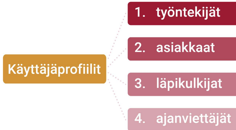
Kaavio 3 - Kontulan ostoskeskuksen käyttäjäprofiilit

joidenkin yrittäjien tiloissa toimii toinen yrittäjä esimerkiksi lihatiskillä. Tämä tekee pienistäkin liikkeistä tavaratalomaisia. Kontulan ostoskeskuksen yrittäjistä ei voi muodostaa pätevää keskiarvoryrittäjää, mutta selkeyden vuoksi yrittäjät sekä heidän työntekijänsä on niputettu tässä työssä yhteen käyttäjäprofiiliin (Kaavio 3).