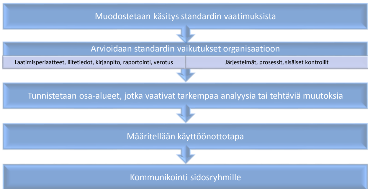
Kaavio 1 (Jalkanen-Steiner & Tuomala 2014): Uuden standardin käyttöönotossa huomioitavat osa-alueet.