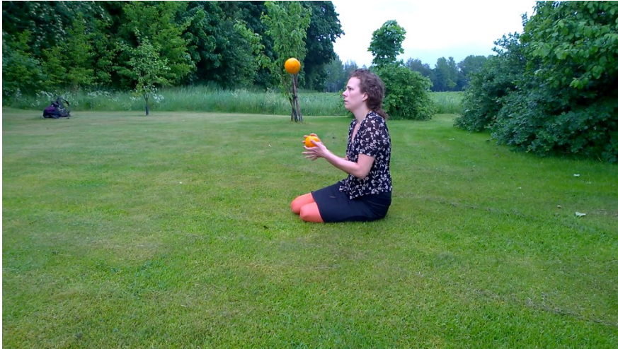
Kuva 1. Performanssi: Appelsiinipuu. Vuojoen kartano Eurajoki 2014. Still-kuvat videosta. Video Jussi Matilainen.

niitä suomessa nimitettiin, liittyy tuo outous ja hämmästely, kun niiden sisällä kasvatettiin eksoottisia hedelmiä, jotka eivät yleensä olisi Pohjois-Euroopan talven keskellä. Hedelmiä ei jaksakaan ihmetellä, kun niitä on aina tarjolla, vaikka ne maistuvatkin erilaisille eri vuodenaikoina, makeus ja koostumus vaihtelee. Vuojoen vihreässä maisemassa, vihreätä omenapuuta vasten nuo appelsiinit näyttävät värikkäämmiltä, niitten makeutta alkaa kuvitella, niistä tulee harvoja ja valittuja. Jalkani ovat osa tuota oranssia hehkua sukkahousujen ollessa appelsiinien väriset. Kaksi appelsiinia, mutta vain yksi syöjä, kaksi vaikuttaa runsaalta yhdelle. Puhun yhdessäolosta ja kesäisistä kohtaamisista ja siihen mihin ne voivat johtaa. Ruuan jakaminen on keskeistä toisen kanssa olemisessa, mutta tässä syöjä pitää itsellään kaiken syötävän. Ohjeistan miten voi ja kannattaa käyttäytyä, jos menee toisen kanssa ulos retkelle tai leiriytyy. Esitys on ohjekirja toisen huomioimiselle ja yhteisen tilanteen jakamiselle. Varoitan kävyistä selän alla ja muurahaisista maassa, välillä jongleeraan appelsiineilla, kunnes lopulta imen niistä mehut. Ne olivat hyvin mehukkaita, ja mehua valui suupielistä; runsauden ja hedelmällisyyden kohtaus kartanon puutarhassa. Appelsiinit olivat kuin reliikki talvipuutarhasta, sen menneestä loistosta, jaettaessa oppia intiimistä hetkestä.