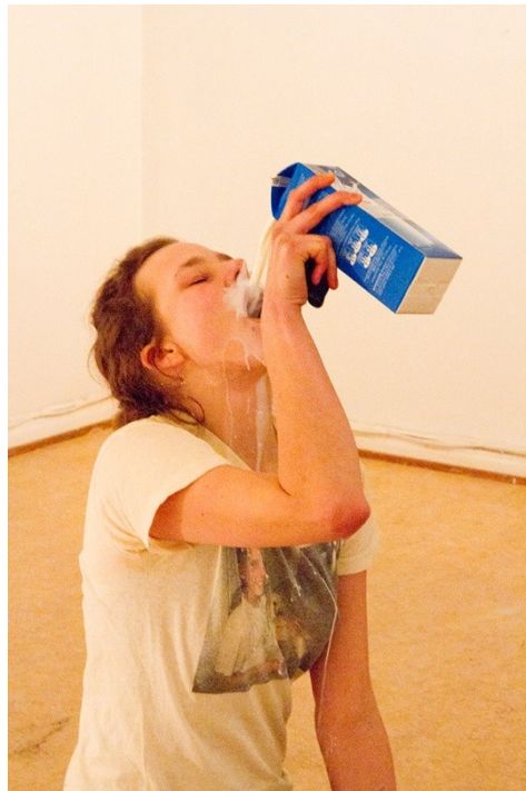
Kuva 2. Performanssi: P-klubi. Galleria 3h+k Pori 2014.

Maitotölkin läheisyyteen meneminen oli yksi paikka lisää tarttua loputtomiin visuaalisiin tehokeinoihin, näkymisen kulminaatiopiste tai dramaattinen poljento kaikesta muusta hääntämisestä. Kaadoin maitoa tarpeettoman korkealta avonaista suutani kohden yrittäen tähdätä suuhun sen paljolti valuessa yli. Paine alaspäin oli myös sen verran suuri, että neste pärskähti pois kieleltä. Oman käden tahdonalainen ojennus korkeammalle kuin olisi tarpeellista, ja alaspäin kaadettu maitovirta olivat turhan oloinen jännitysmomentti verkkaisesti kulkeutuneissa touhuissa, se oli ärsyke. Tuon kaatamisen aikana kuulin tiheiden kameranlaukauksien äänien alla viivaavan näyttävyttä. Se muistutti itseä oman käden kautta tapahtuvasta ruokkimisesta, ravinnon ja visuaalisen ponnekkouden antamisesta oman läsnäolon esitykseen. Se oli myös tunnistettavan ja käytännöllisen esineen ja tuotteen kokeilemista toisesta suunnasta: kuinka helppoa on osata tarttua johonkin tuttuun, avata maitotölkki ja hallita liikeratojaan, kaataa, juoda ja sulkea, ja kuinka helppoa on kokea vaikeus tehdä järjestelmällistä toimintaa, nähdä tarkoituksettomuus ja sen avaamat muutokset esineiden kanssa olemisessä. Tölkki on suljetuna helppo käsitellä, avattua sen, sen sisältö voi ottaa hallitsemattomasti tilaa haltuun, hyppiä silmille. Palatessani matalalla takaisin lamppuni ääreen, nousin ylös seisomaan ja sammutin sen isovarpaallani. Itsekorostustematikan jälkeen tuntui sopivalta pimentää kohdevalo ja kävellä pois.