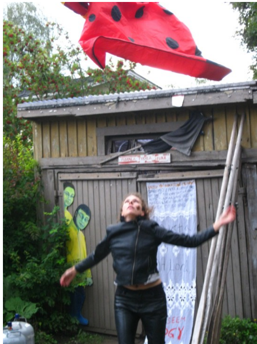
Kuva 1. Performanssi:fiesta. Hirvitalo Tampere 2014.

rauhottua. Sitä kiihottaa itseään hukkaamaan painoan ja janoaa korkeuksiin, tarkkailee jos ilmaantuisi nopea impulssi johon pääsisi kiinni ja joka veisi mukanaan. Laitoin makuupussin sisäpuoli ulospäin maahan alustaksi, se teki toimintasektorin, punaisena hehkuvan yhdenmahduttavan alueen. Sen keskellä seisoesani huidoin katsojiin päin ilmaa kepillä. Yleisön tai katsojan katseen ottaa raskaasti, se on kuin isku kohti tai tarkkailumassa, joka odottaa kohteensa toteutumista. Kepillä piiskasin iskuja tuohon väliin ladaten lisää jännitettä katsojan ja esiintyjän rajalle samalla rangaisten yhteistä tilaa ja sen rakenteen ahdistavuutta. Koko esityksen ajan minulla oli silti jotenkin huvittunut olo, outo vapautuminen ja itsen viihdyttäminen sen pakottamisen ja vaikeuden kokemuksen tilalla mikä yleensä luo painetta noissa tilanteissa, ja raskauden ja kuluttavuuden ennakkoletuksia. Välillä ujostuttaa, oudoksuttaa se miten tökkii lähelle tulijoita, hätistelee vähän kauemmaksi. Se aiheuttaa hämmennystä, jonka haluaa vallita hetken, unohtua siihen ennen kuin jatkaa. Ehkä se aiheuttaa haparoivaa jatkumoa, kun jää hämmästelemään kaikkea mihin tarttuu tai mitä pystyy tekemään ja mikä jää yri-tykseksi. Sitä etenee nykäyksittäin, välillä eteneminen raukeaa.