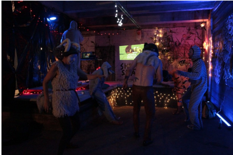
Kuva 1. Performanssi: Sheep Shack, Tehdas ry. Katlamaja Pärnu 2014

Ilmeiden ja katseen voimaa tuodaan ilmi, silmien välähtelyä ja katseiden kohtaamista. Katsekontaktin saamista alleviivataan ja tavoitellaan, arvostetaan läsnäoloa ja yksilön ilmaisijana. Toisaalta performanssissa korostuu usein ilmeettömyys tai yksi ilme, kivikasvoinen tilannetajun harrastaja. Silmiin liimattu välittömyys kehkeytyy parodiaksi, sentimentaaliseksi osoitukseksi siitä, että on tunteet. Teatraalisuutta kaipaa, mutta pitää yleensä sen yhden ilmeen. Suomifilmissä silmät hehkuvat: ”.. huomio kiinnittyi Regina Linnanheimon silmiin: viettelyyn siristyvät ja rakkaudesta sädehtivät silmät muuttuvat sairauden puhjetessa pistäväksi katseeksi, villisti pyöriviksi, valkuaisen hallitsimiksi ympyröiksi, samalla kun kasvonpiirteet vääristyvät, suu vetäytyy katkeriin juonteisiin tai jähmettyy väkinäiseen hymyyn, jota usein säestää kolkko nauru.” 20