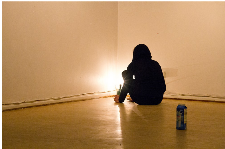
Kuva 1. Performanssi: P-klubi. Galleria 3h+k Pori 2014.

liikkeisiin, tunne siitä että painostetaan ja painostaa itseään näkymään, saa unohtamaan kuinka on jo muutenkin esitys itsestään ja yksilöstä toimimassa, kuinka asiat heijastuvat pysähtymättä kiteytykseen tai paljastukseen itsestä avoimempana ja läsnä olevampana jossain hetkessä. Olemisen paljastamattomuus, se ettei voi etsiä todellisempaa kuvan alta, kohdistaa itsensä merkitystä ja hankkia sille näkyvyyttä, tekee myös toisen ytimen etsinnän tyhjäksi. Operointi toisen saavuttamiseksi ja avaamiseksi, kohtaamisen ideoiminen, katkeaa outoon hiljaisuuteen ja puolittaisiin tarkoituksiin, ehkä kesken jääneisiin lauseisiin. Oman sanomisen kohde on siinä edessä ja näköksällä, halu ilmaista jotain kuuluville ei katoa, mutta siitä tulee väkinäisempää, äänessä oleminen ja tilan ottaminen vaikuttavat kyseenalaisemmilta.