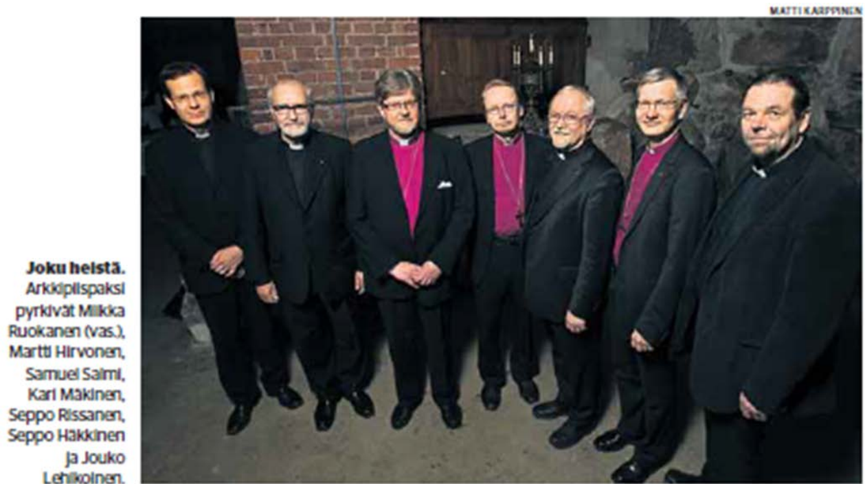
Kuva 3. Matti Karppisen valokuva ( Kirkko ja kaupunki 4/2010, 5)