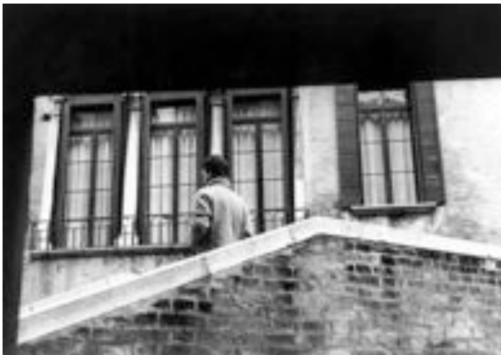
Sophie Calle, kuva kirjasta Suite Vénitienne (1980) 12