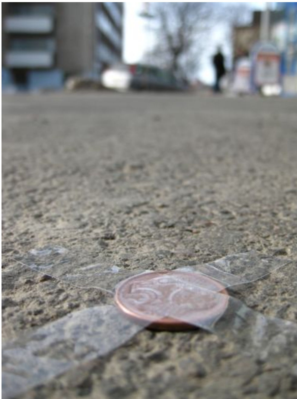
A Monument of Confusion and Shame (2011- jatkuva)