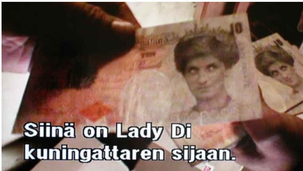
Banksyn painamia seteleitä.